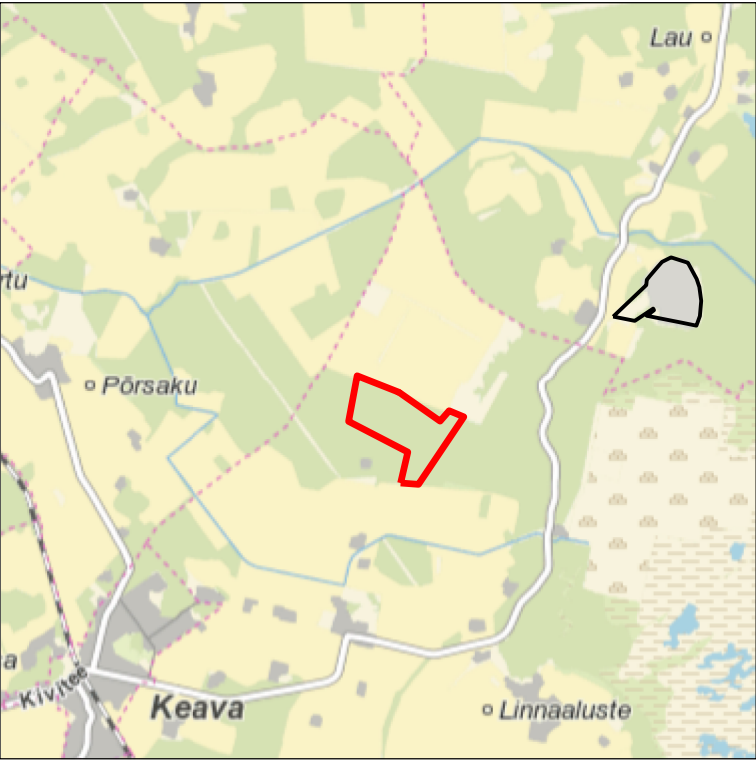
Kaardileht nr 6323 Kau